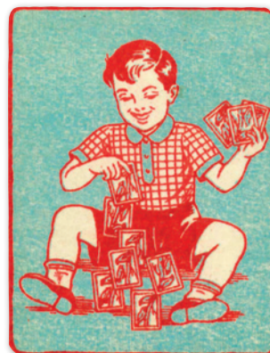
Indisches Kartenspiel, Rückseite um 1940