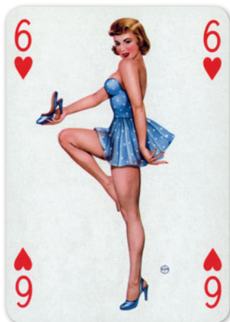
Pin-Up-Karte «Baby Dolls» 1958