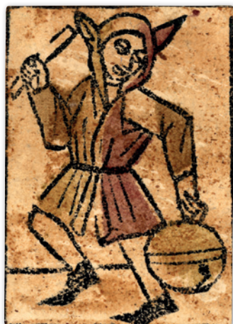
Schellen-Unter um 1520

Anschliessend Apéro und Ausstellungsbesichtigung