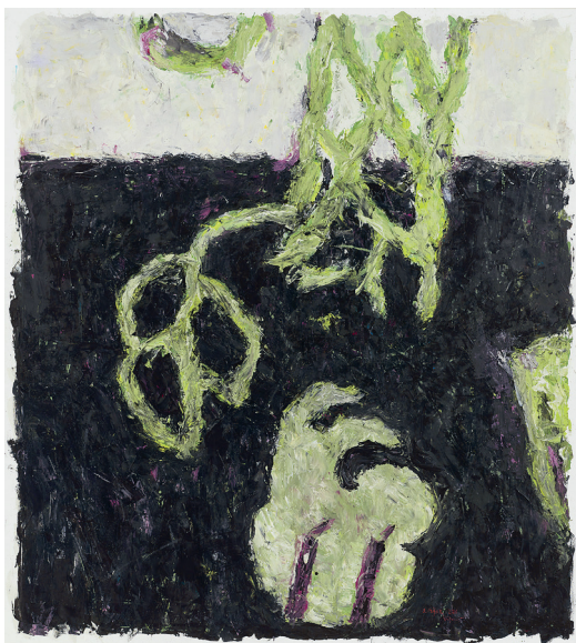
Nie mehr mehr II , 2016 Öl auf Leinwand, 200 x 180 cm