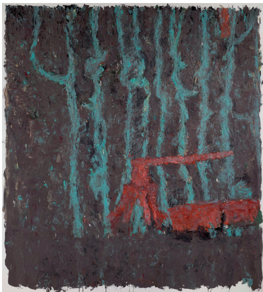
Hodlers Spiel I , 2013 Öl auf Leinwand, 200 x 180 cm