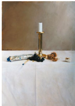
Erwin Gloor, Herbstliches Stillleben , 2012 Öl auf Leinwand, 70 x 50 cm Privatbesitz

«Pixel, Pinsel und Pigmente». Dialogischer Workshop zur Ausstellung für die Stufen Sek I & II. Termine nach Vereinbarung. Mehr Infos auf www.allerheiligen.ch